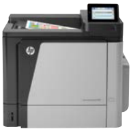
HP Color LaserJet Enterprise M651dn

Cuente con desempeño. Imprima documentos a color a doble cara con calidad profesional, en tamaño carta y A4, con una confiabilidad excelente. La impresión eficiente con un toque y las opciones de impresión móvil, más una administración simple, lo ayudan a ser productivo donde lo lleve su trabajo.